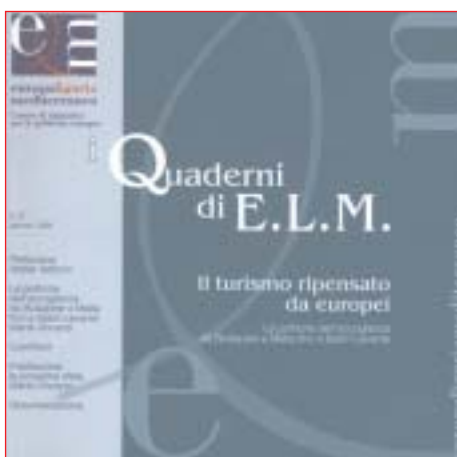
Il secondo numero della rivista